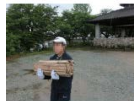
明石市立少年自然の家