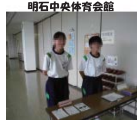
明石中央体育会館