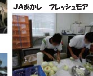
JAあかし フレッシュモア