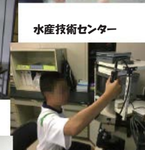
水産技術センター