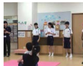
ふれあいプラザ明石西