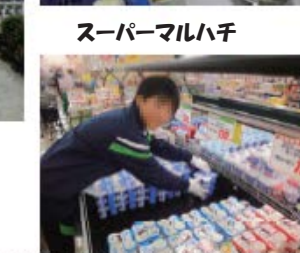
スーパーマルハチ