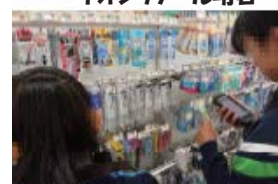
イオンリテール明石