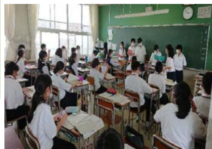
生徒総会議案書討議の様子