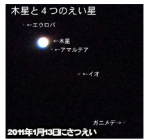
望遠鏡で撮影しました