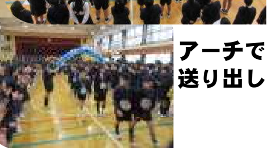
アーチで 送り出し