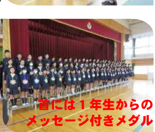
首には1年生からのメッセージ付きメダル