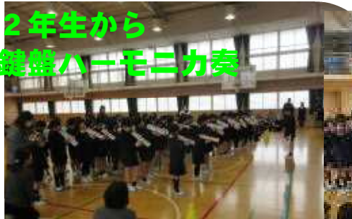
2年生から 鍵盤ハーモニカ奏