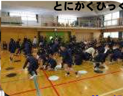
とにかくひっくり返す