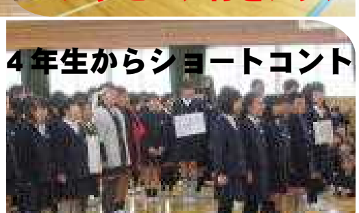
4年生からショートコント