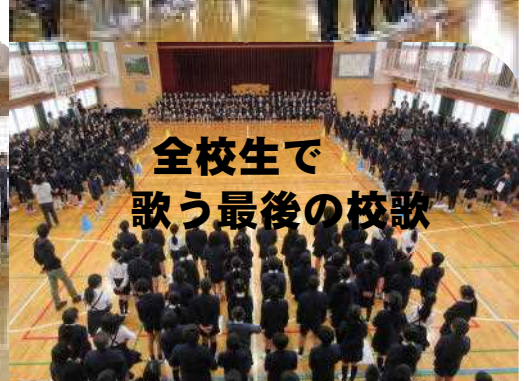
全校生で 歌う最後の校歌