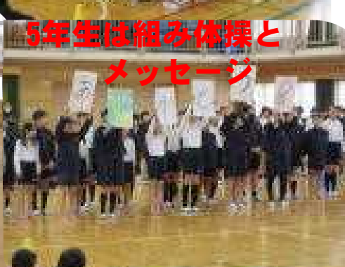
5年生は組み体操と メッセージ