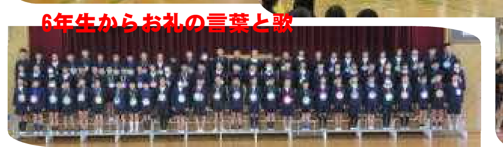
6年生からお礼の言葉と歌