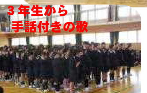
3年生から 手話付きの歌