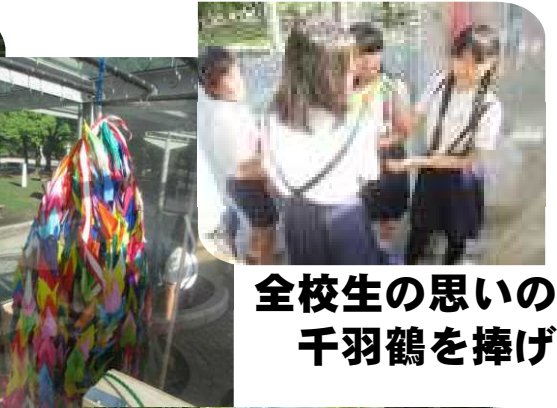
全校生の思いの 千羽鶴を捧げ