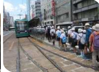
後は帰るだけ 広電に乗って