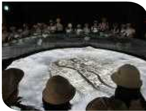
リニューアルした原爆資料館へ ペットボトルに入れた ここにも届けた