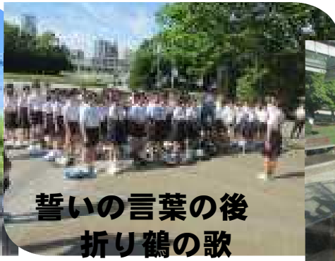
誓いの言葉の後 折り鶴の歌