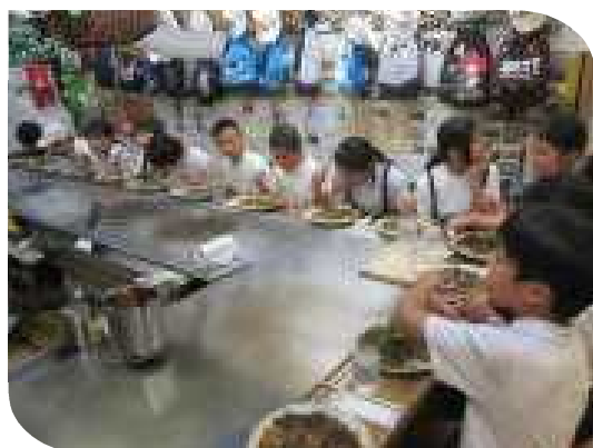
お好み村で、おいしかった～