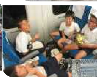
新幹線 おやつ タイム